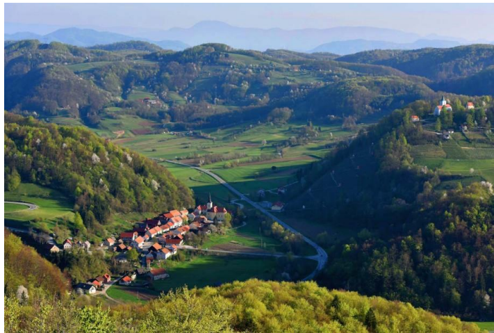
Slika 4: Kozjanski park