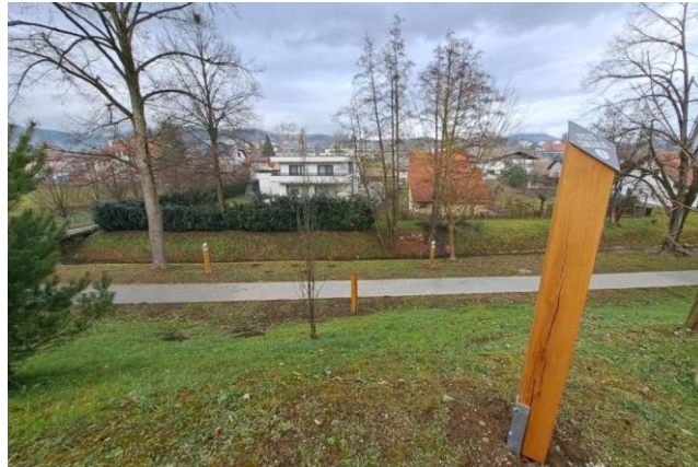
Slika 3: Keltski horoskop v Šmarju pri Jelšah